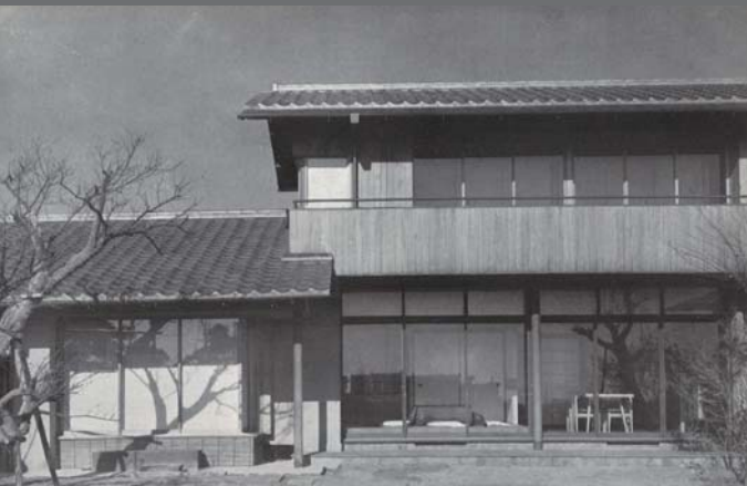
角川庭園（旧角川源義邸）